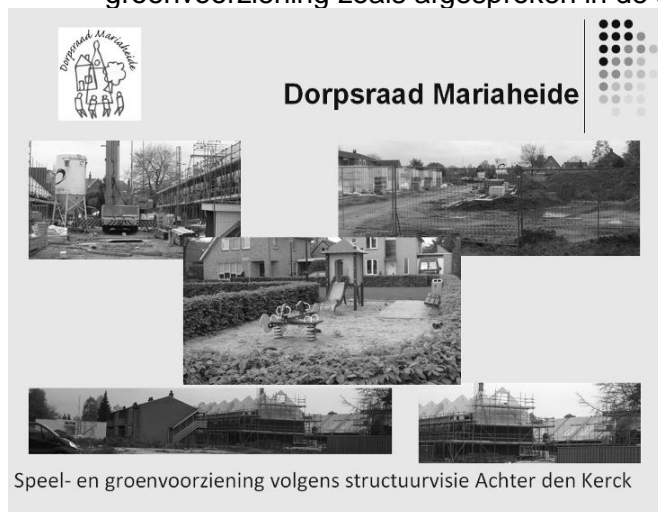
Speel- en groenvoorziening volgens structuurvisie Achter den Kerck